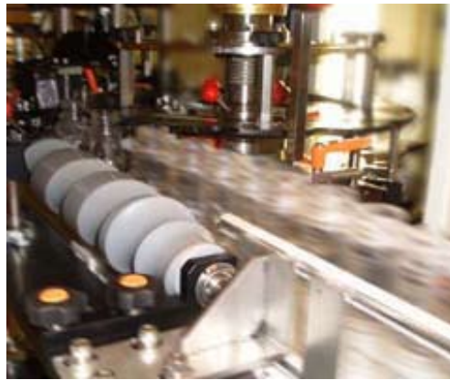
スクリュー機構でスムーズなハンドリング