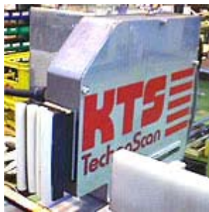
ハイスピードブッシャー