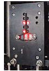
数字による圧力表示