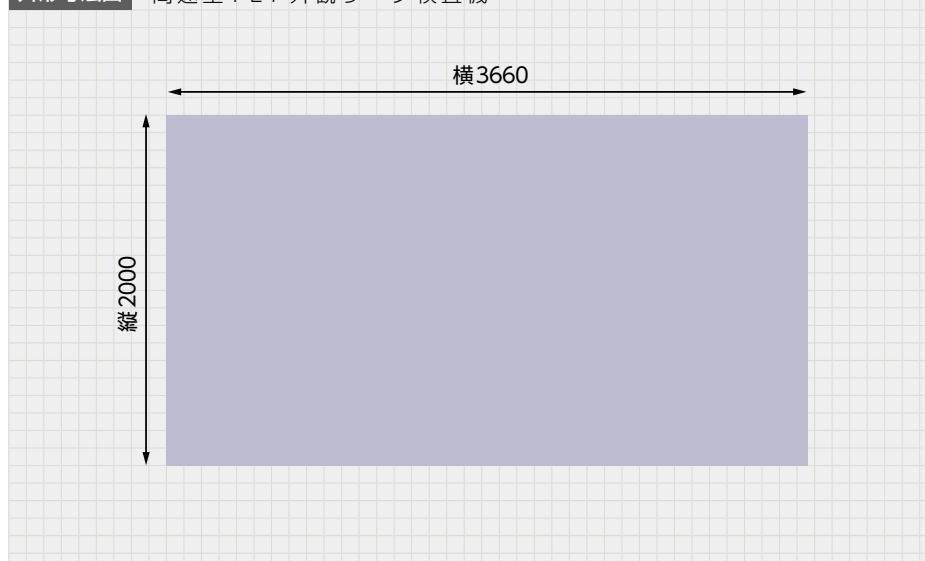
外形寸法図 高速空 PET 外観リーク検査機